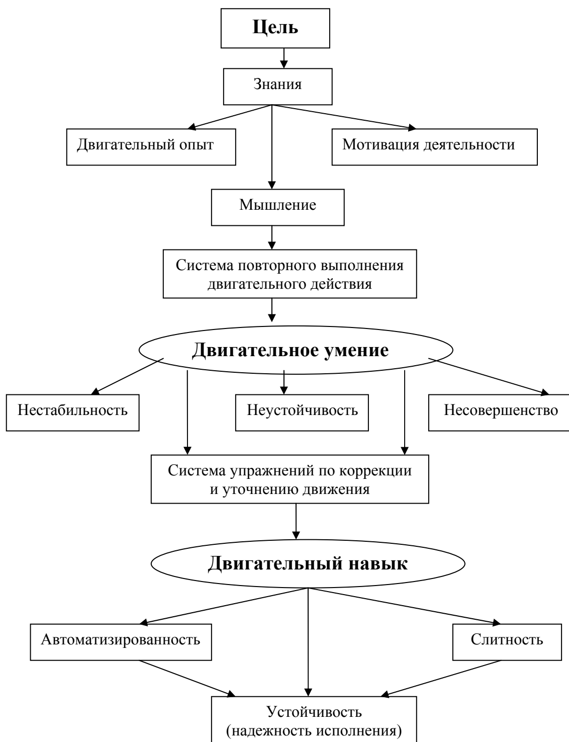
Рис. 6. Формирование двигательного умения и двигательного навыка

основная задача – научить ученика свободно владеть навыками в любых условиях. Схематично различия между умением и навыком и переход умения в навык можно представить следующим образом: