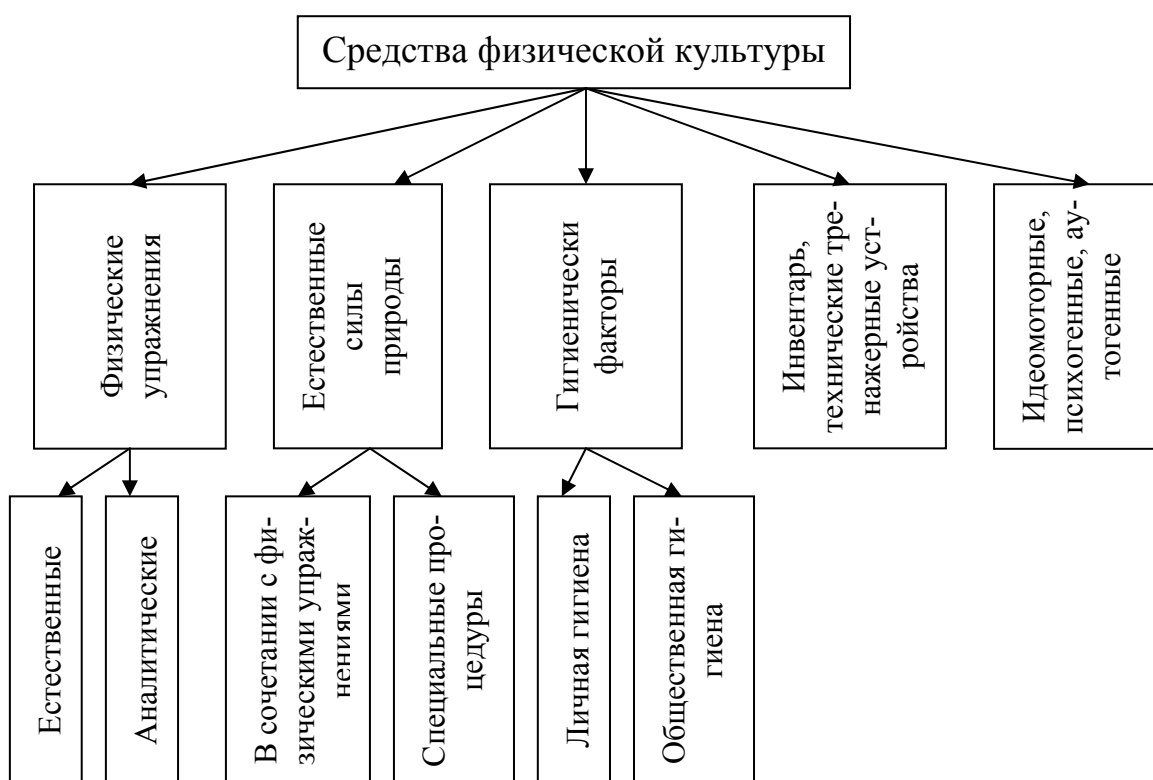
Рис. 2. Средства физической культуры

Представление о содержании понятия «физическое упражнение» тесно связано с такими понятиями как «движение» и «двигательное действие».