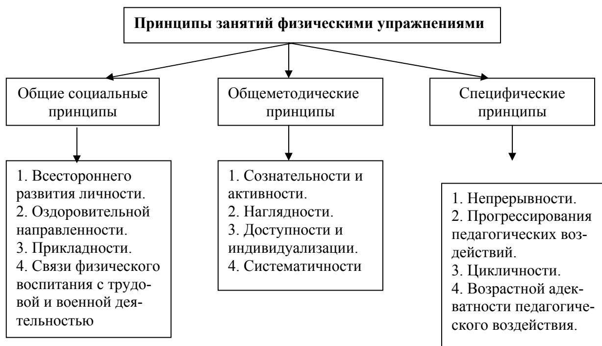
Рис. 5. Система принципов в физической культуре

Различают социальные, общепедагогические и специфические принципы (рис № 5):