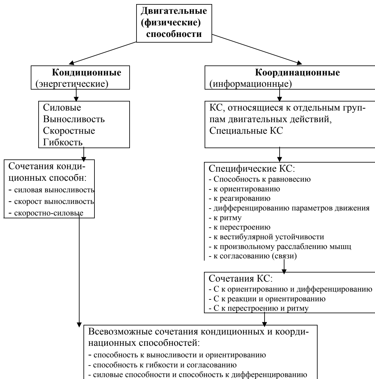
Рис 7. Схема систематизации физических способностей

Класс кондиционных, или энергетических способностей в значительно большей мере зависит от морфологических факторов, биомеханических и гистологических (наука о тканях) перестроек в мышцах и организме в целом.