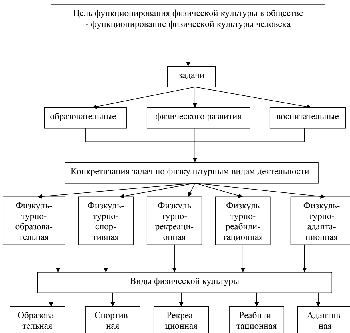
Рис. 1. Конкретизация задач, решаемых в сфере физической культуры в зависимости от характера физкультурной деятельности (Ю.Ф. Курамшин)

3. Организационные основы. Система физической культуры существует в государственных и общественно-самодеятельных формах организации, руководства и управления.